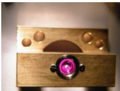
Ankerbrücke mit Rubin