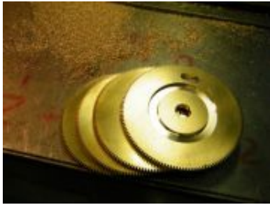
vier fertige Walzenräder