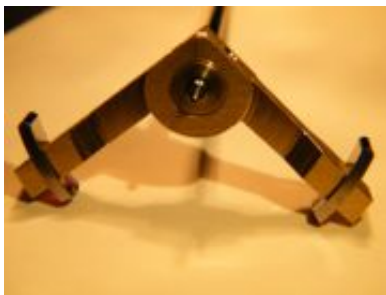
Anker mit Rubinpaletten