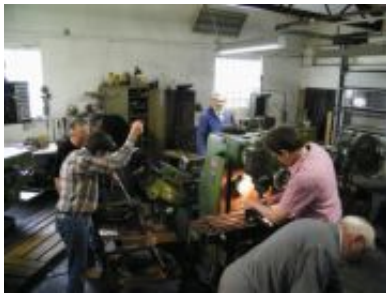
bei der Produktion